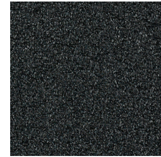
Step Up 989 LRV: 2,51