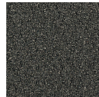
Step Up 983 LRV: 5,16