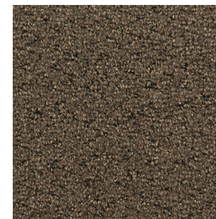
Step Up 859 LRV: 4,52